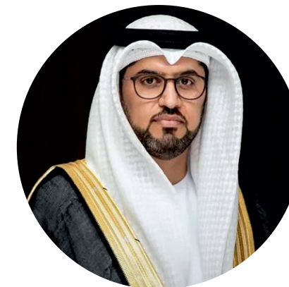
Мохаммад Ахмад Аль-Джабер Посол ОАЭ в России