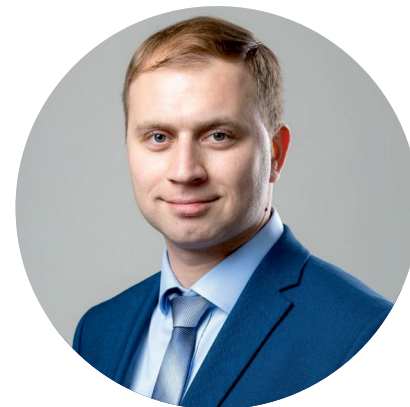
Чекушов Роман Андреевич Директор департамента международной кооперации и лицензирования в сфере внешней торговли Министерства промышленности и торговли РФ