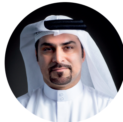
Фахад Аль Гергави Генеральный директор дубайского центра инвестиционного развития