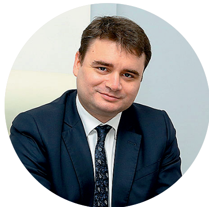
Осьмаков Василий Сергеевич Первый Заместитель Министра промышленности и торговли РФ