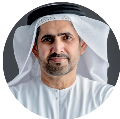
Ghanim Al Falasi Старший вице-президент по технологиям и предпринимательству в Силиконовой Долине Дубая